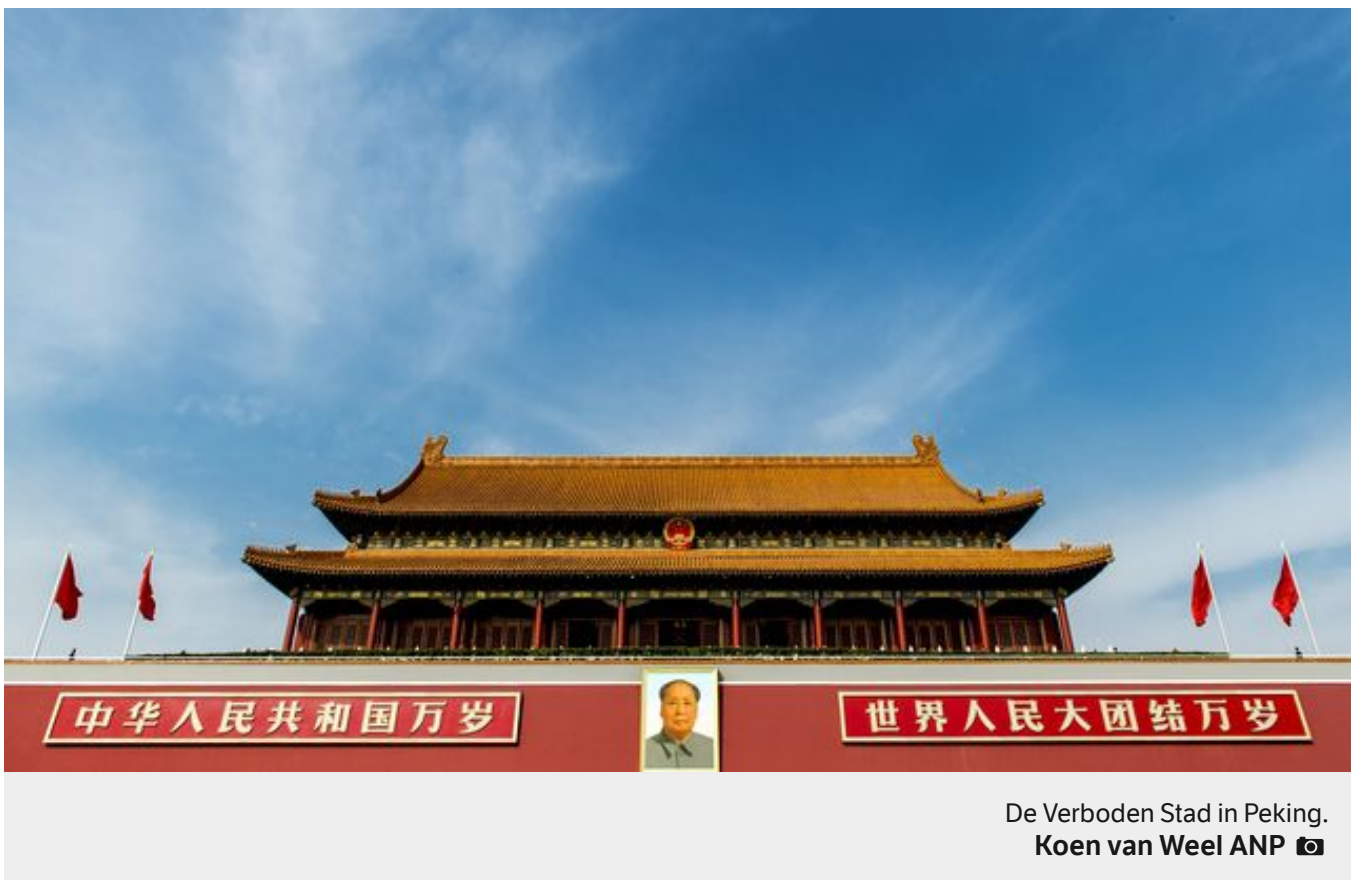
De Verboden Stad in Peking.

🔗 Oscar Garschagen 🕒 8 december 2016 om 14:09